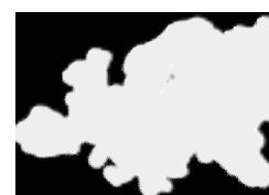
Figura 1 La mappa della Sanità Pubblica in Europa

Quasi sempre la denominazione riflette il momento evolutivo che la disciplina attraversa in quel determinato Paese e che, storicamente, per quanto attiene le definizioni, è schematizzabile secondo il cronogramma riportato in figura 2.